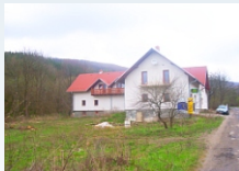
Predmet: Penzión BESKYDY, súp. č. 196 v k. ú. VYDRAN, okr. Medzilaborce a pozemky s výmerou 1954 m2. Kontakt: 0903/236 164, 0911/236 164, 0918/186 364, 02/59490120