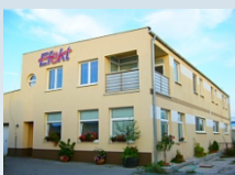
Prípravujeme dražbu výrobné cukrárskych výrobkov v PEZINKU. Kontakt: 0903/236 164, 0911/236 164, 0918/186 364, 02/59490125