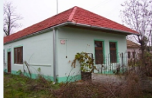
Predmet: Rodinný dom so s. č. 132 v kat. úz. Čajakovo, obec HRONOVCE, okr. Levice, výmera pozemkov 1513 m2. Kontakt: 0903/236 164, 0911/236 164, 0918/186 364, 02/59490111