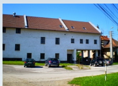
Mlyn a sklad s príslušenstvom v ZLATÝH MORAVCIACH. Kontakt: 0903/236 164, 0911/236 164, 0918/186 364, 02/59490120