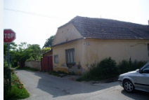
Predmet: Rodinný dom so s. č. 375 v obci ŠOPORŇA, okr. Galanta, parc. číslo 741, výmera pozemku 395 m2. Kontakt: 0903/236 164, 0911/236 164, 0918/186 364, 02/59490111