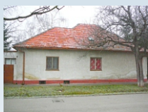
Predmet: Pozemok pod RD v Devínskej Novej Vsi na ulici Pod Lipovými, výmera 352 m2. Kontakt: 0903/236 164, 0911/236 164, 0918/186 364, 02/59490111