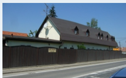
Predmet: Rodinný dom s príslušenstvom v ZÁHORskej BYSTRICI, s. č. 7166, celková výmera pozemku je 617 m2. Kontakt: 0903/236 164, 0911/236 164, 0918/186 364, 02/59490124