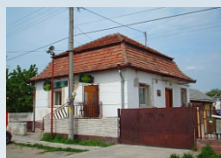
Predmet: Reštaurácia, s. č. 2428 s príslušenstvom v KOLÁROVE, okr. Komárno a pozemky s výmerou 167 m2. Kontakt: 0903/236 164, 0911/236 164, 0918/186 364, 02/59490119