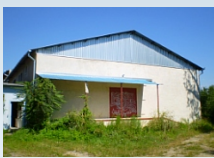
Rozostavaná budova v obci BÁTŮVCE, okr. Levice Kontakt: 0903/236 164, 0911/236 164, 0918/186 364, 02/59490124