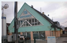
Predmet: Regeneračno-rekondičné centrum na Čerešňovej ulici 32 so súp. č. 4970 v BANSKEJ BYSTRICI, kat. úz. Kremnička, výmera pozemkov 244 m2. Kontakt: 0903/236 164, 0911/236 164, 0918/186 364, 02/59490125