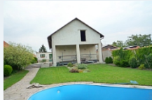
Rodinný dom so súpisným č. 9755 na Nákovnej ulic v BRATISLAVE, m. č. Podunajské Biskupice. Kontakt: 0903/236 164, 0911/236 164, 0918/186 364, 02/59490125